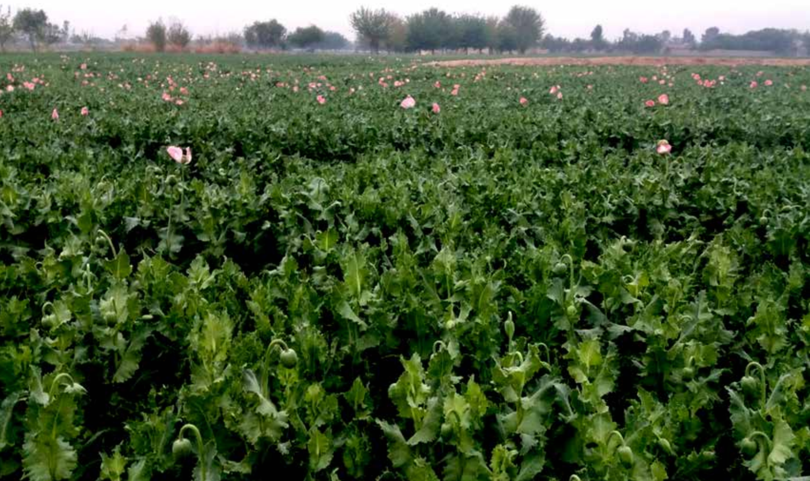
اوم شکل: د هلمند د کانال د قومانداني په سيمه کې د ترياکو سالم کښت، د ۲۰۱۸ کال اپريل

په دغه سیمه کې د کوکنارو د کرکيلې او د ترياکو پرلابراتوارونو د بريدونو په تړاو، د خلکو اندونه او ليدلوري د مرکزي هلمند د نورو سيمو په پرتله، ډېر توپير لري. په ټوليزه توگه، د دغو دوو سيمو بزگران د حکومت له هڅو څخه ملاتړ کاوه، او د هلمند د سيند پر غاړه پر نشه يي توکو د روږدو کسانو د شمير ډېرزياتيدل يې، د ترياکو د توليد منفي اغيزه گڼله. ۳۴ په بولان کې يو ډول هوساينه احساس کيده، چې سرکال کرونډ گرو ترياک نه دي کرلي، د دې سيمې خلکو هغوی پر دې پوهيدل چې د ترياکو د بيو راتيټيدل، د دې مانا ورکوي، چې د ترياکو دغه بېې نه شي کولی د کرکيلې لگښتونه هم برابر کړي.