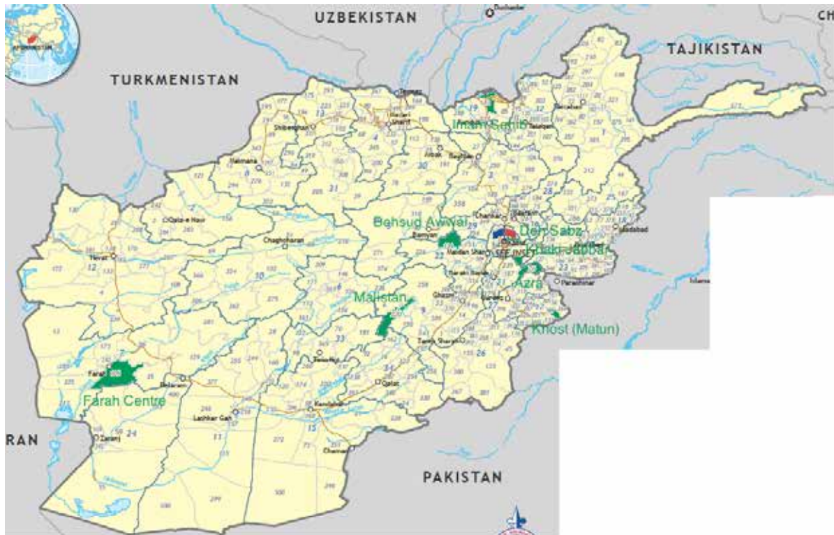
لومړی نقشه: د څېړنیزو قضیو سیمې