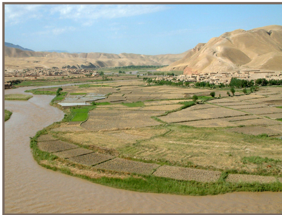
په بغلان کې د یوه سیند د غاړې اوبه شوې برخه (الن روی)