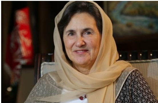
رولا غني، د افغانستان لومړۍ ميرمن

په پيل کې د افغانستان د خپرنې او ارزونې واحد ته د «جنسیت د نابرابرۍ بل اړخ» په افغانستان کې نارینه او نارینتوب» تر عنوان لاندې د هغوی د نوې خپرنې په مناسبت خپلې تودې مبارکۍ وړاندې کوم. د جنسیت د نابرابرۍ دغه اړخ، چې بیا بیا له پامه غورځول کېږي، یو بېړنی او خورا مهم عنوان دی، چې په افغانستان کې د ملي پالیسي او ټولنیزو بدلونونو لپاره ډیر زیات اهمیت لري.